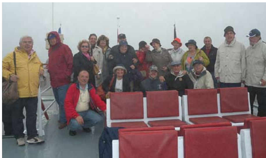
Alla ricerca delle balene