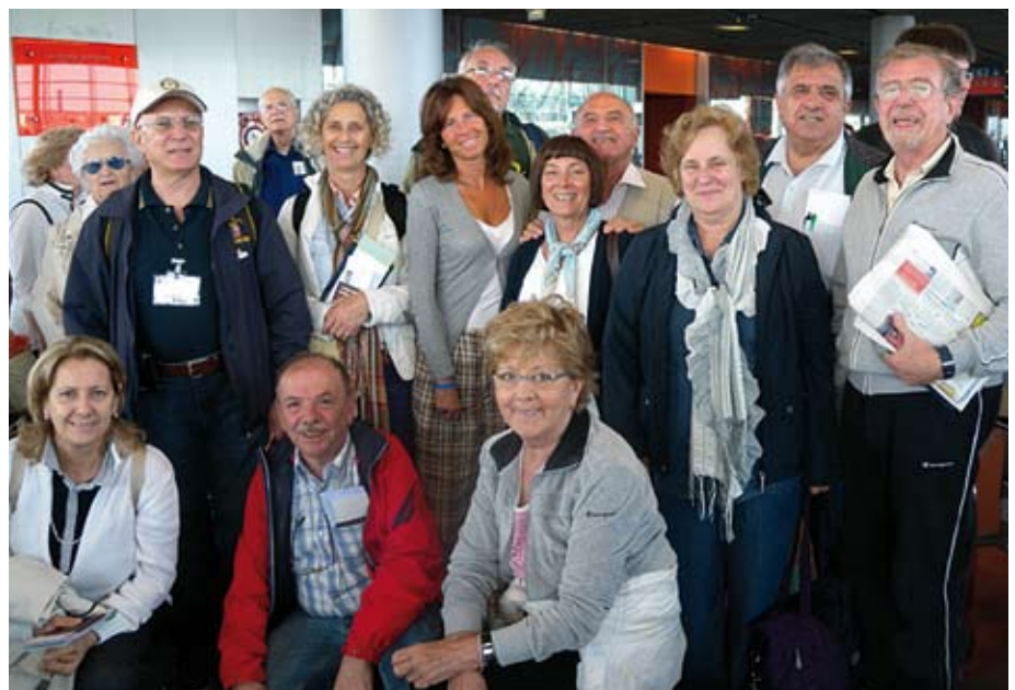
La partenza da Parigi