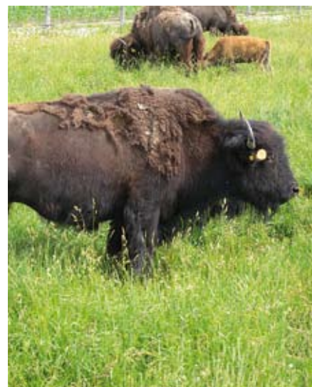
I bisonti nel Quebec